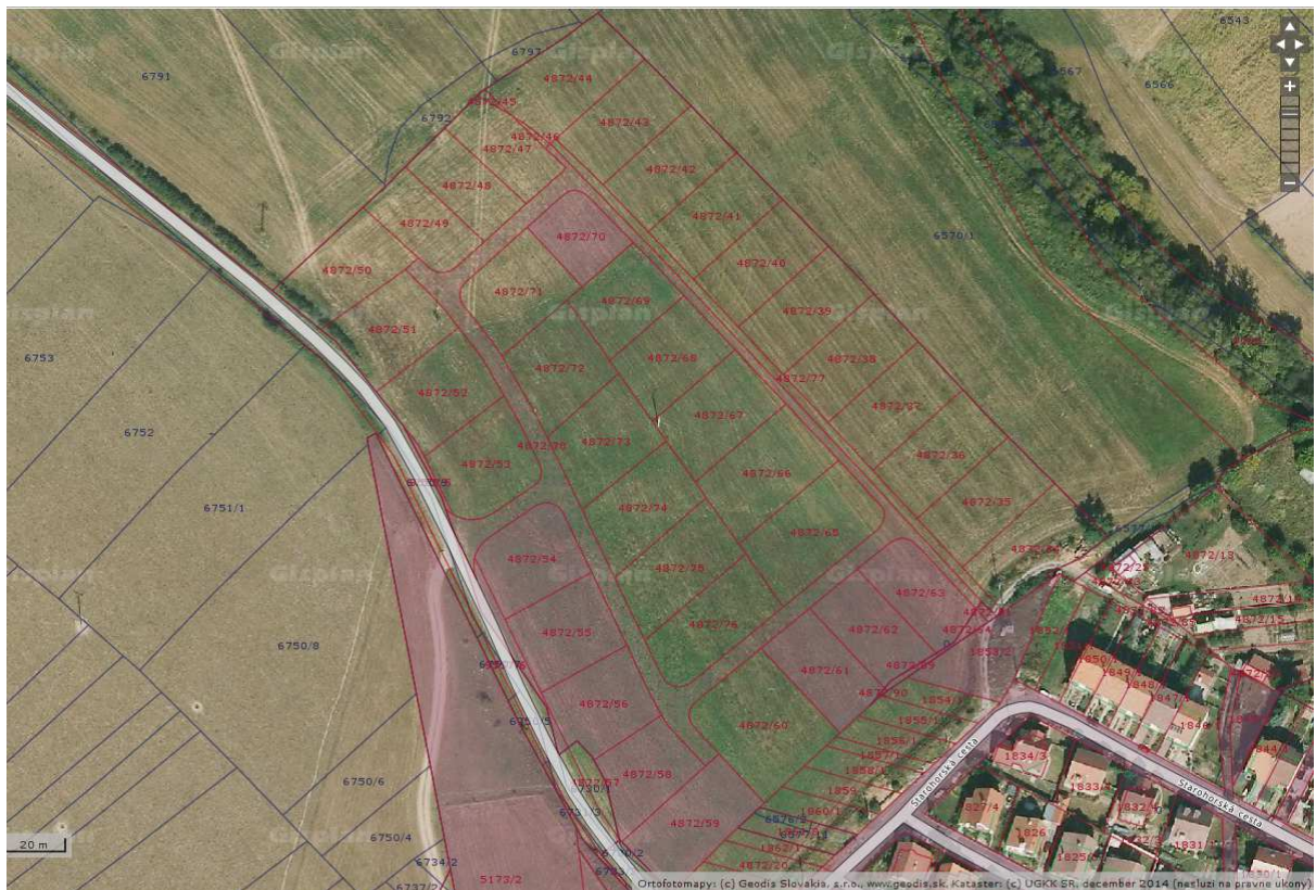
Lokalita Nad Klípochom